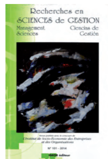
N° 101 - 220 pages FRANCAIS