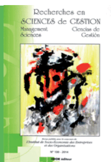
N° 100 - 220 pages FRANCAIS