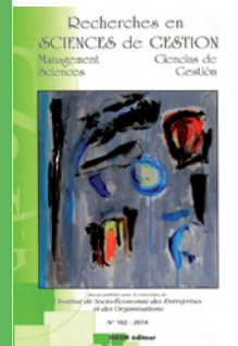
N° 102 - 216 pages FRANCAIS